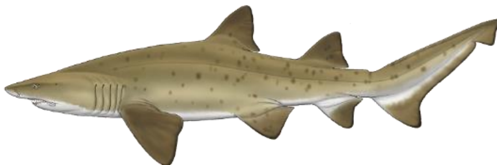
Figure 1 : Illustration adaptée des guides d'identification des requins (Marc Dando - The Shark Trust)

Escalandrún (Argentine), Mangona (Brésil), Sarda (Uruguay),